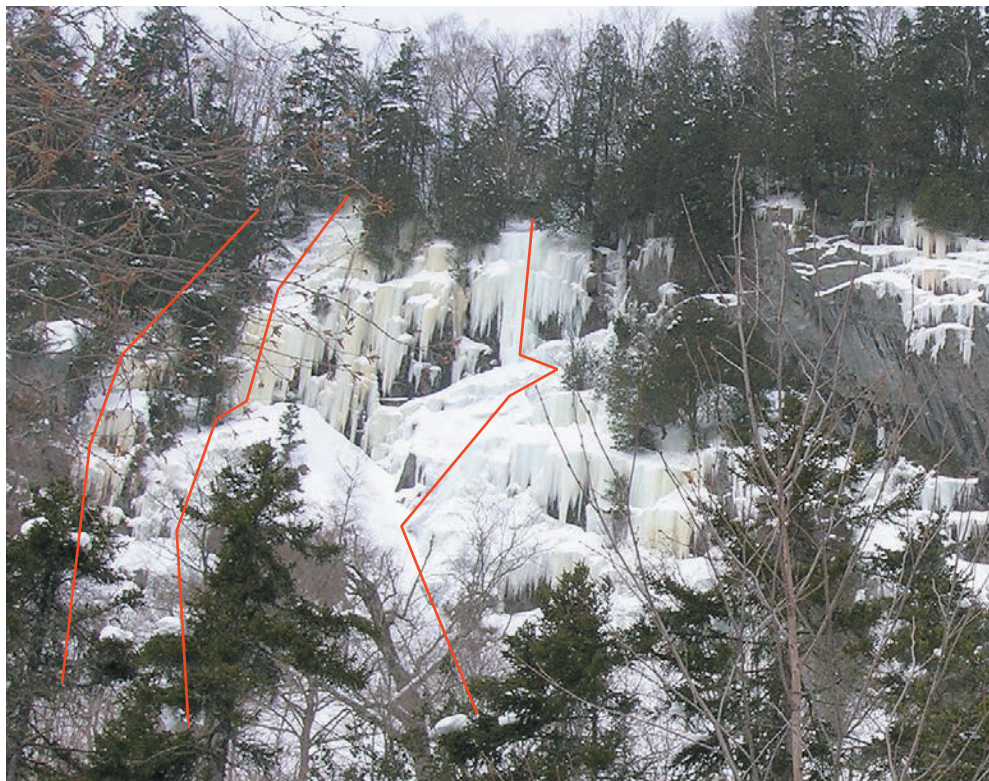
La Belle au B.D. Azur et Jasmin Petite première