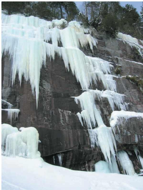
Airproofing, mars 2009