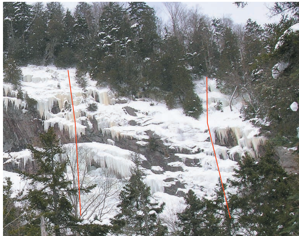
Les Fils de Caleb